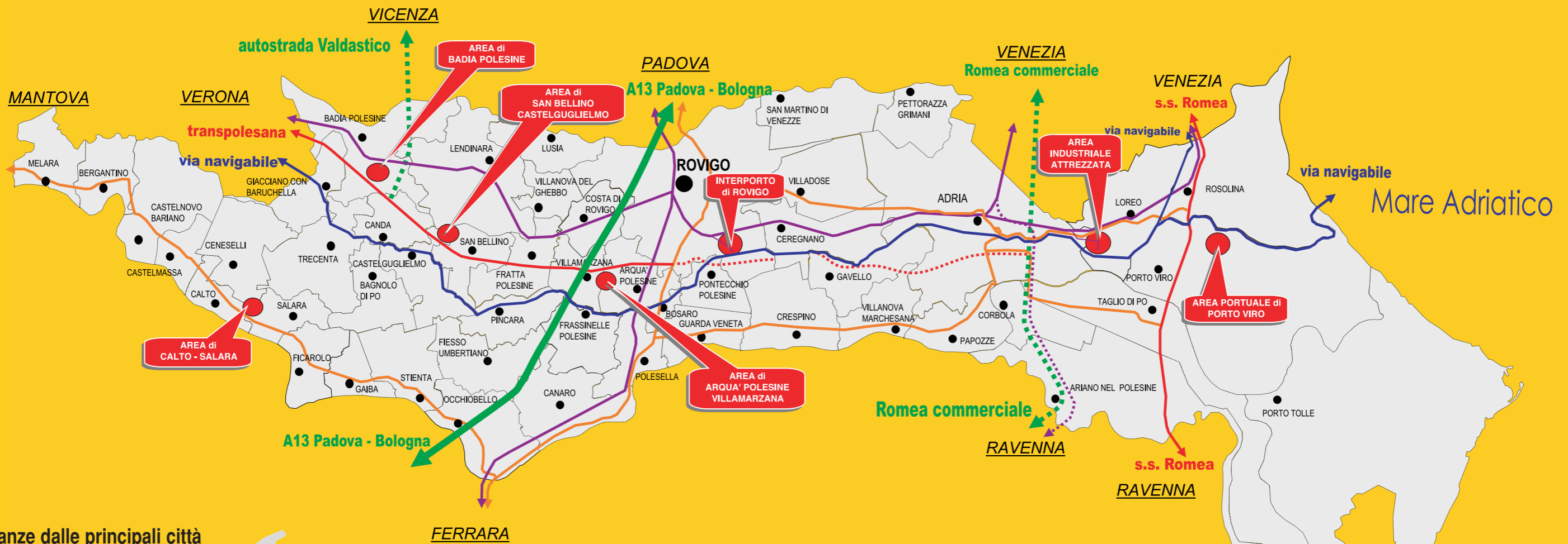
Distanze dalle principali città Distances from main cities